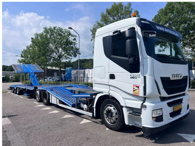
Iveco Stralis 460 6X2 EURO 6 + GS MEPPEL - TRUCK-TRA...