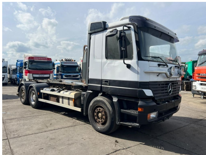
Mercedes-Benz Actros 2640 6X2 EURO 2 - HOOKLIFT