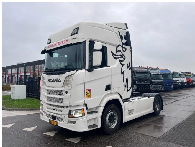
Scania R520 V8 NGS RETARDER + TUV 12/2024