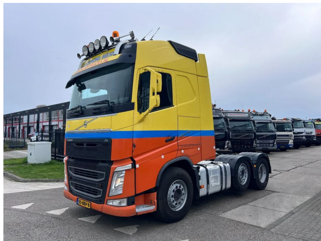
Volvo FH 460 6X2 EURO 6 + KIEP-HYDRAULIEK + STEERI...