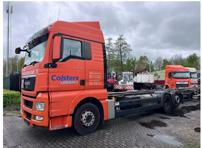
MAN TGX 26.440 XLX 6X2 EURO 5 - BDF CHASSIS + RET...