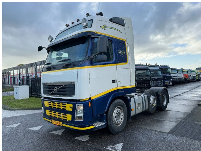
Volvo FH 480 6X2 EURO 5 + HYDRAULICS + STEERING AXLE