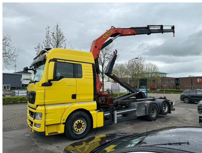
MAN TGX 28.480 6X2 EURO 5 + PALFINGER PK23080 + R...