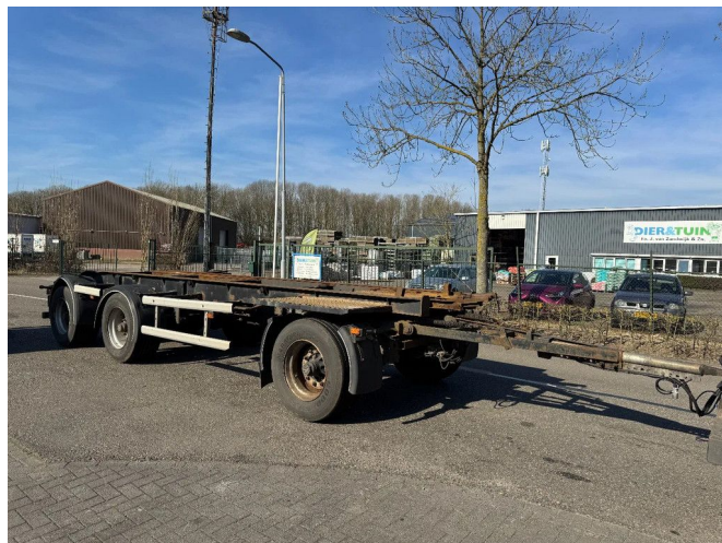
Floor FLA-10-20 - 3 AXLE BPW