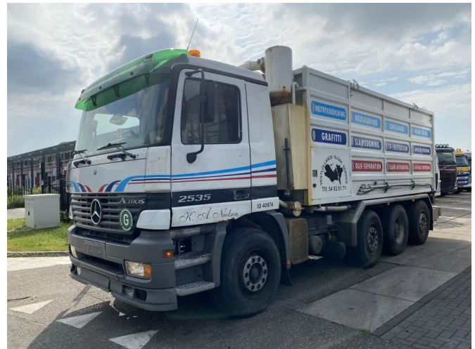
Mercedes-Benz Actros 2535 8X2 + VACUUM CLEANER - 50...