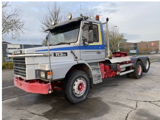
Scania T113-360 6X2 - MANUAL - FULL STEEL