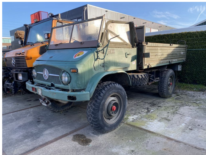
Unimog 404 4X4 *FUEL PROBLEM*