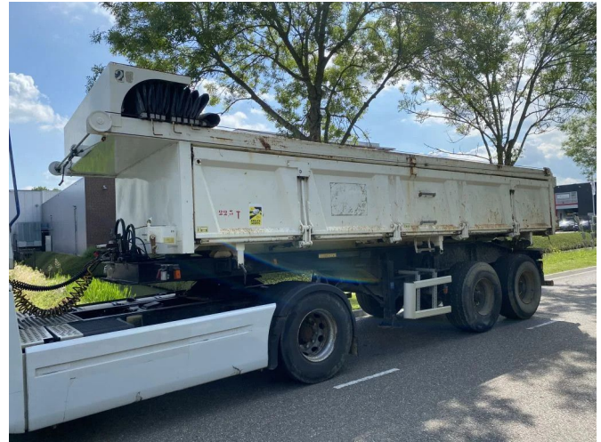
CIF 2 AXLE - STEEL SUSPENSION - TIPPER