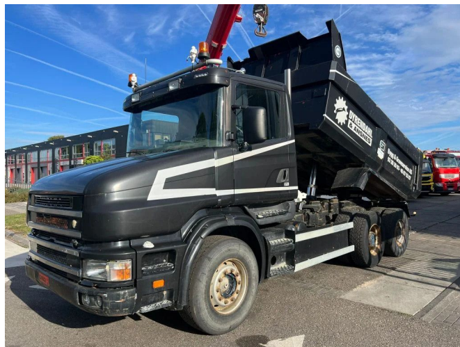
Scania T124-400 6X4 FULL STEEL MANUEL