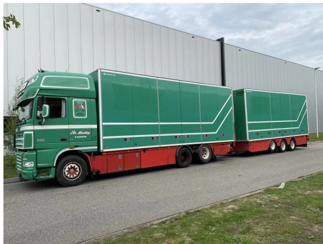
DAF XF 510 XF510 6X2 RETARDER MET AANHANGER