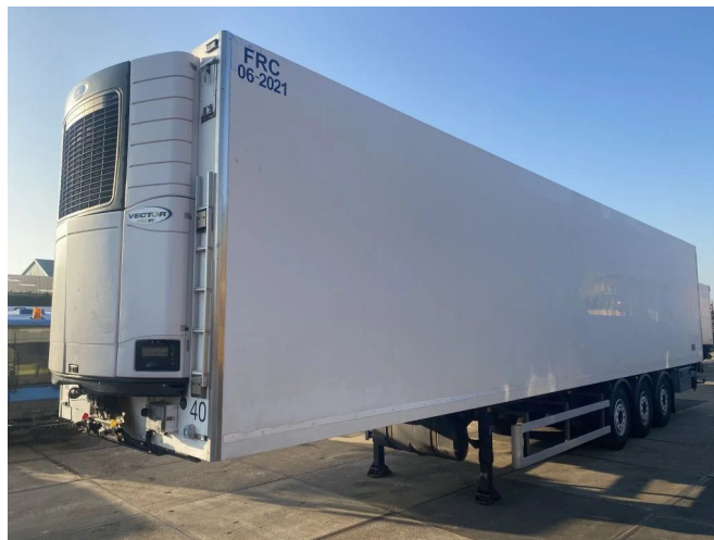
UNITRANS WITH MEATRAILS AND DOUBLE EVAPORATOR