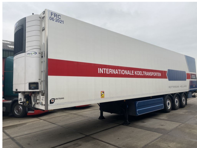
UNITRANS UNITRANS WITH MEATRAILS AND DOUBLE E...