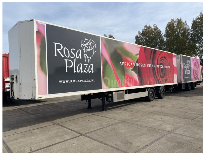
Burg LZV COMBI MET DRACO WZ-30-RF