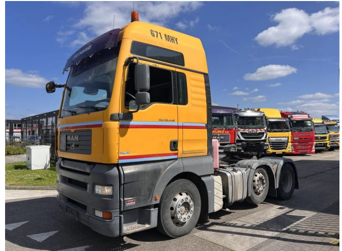
MAN TGA 26.440 XXL 6X2 E4 MANUAL GEAR - TIPPER HY...