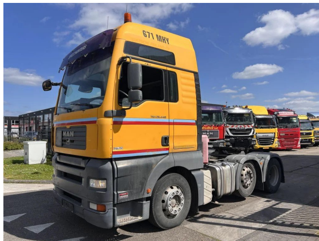
MAN TGA 26.440 XXL 6X2 E4 MANUAL GEAR - TIPPER HY...