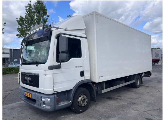
MAN TGL 12.220 4X2 EURO 5 - 12 TONS + DHOLLANDIA