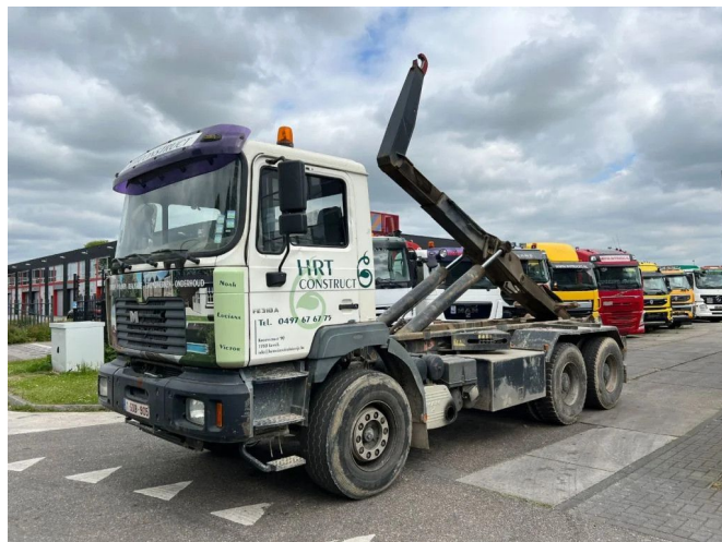
MAN FE 310 A 6X4 HAAKARM - FULL STEEL - MANUAL