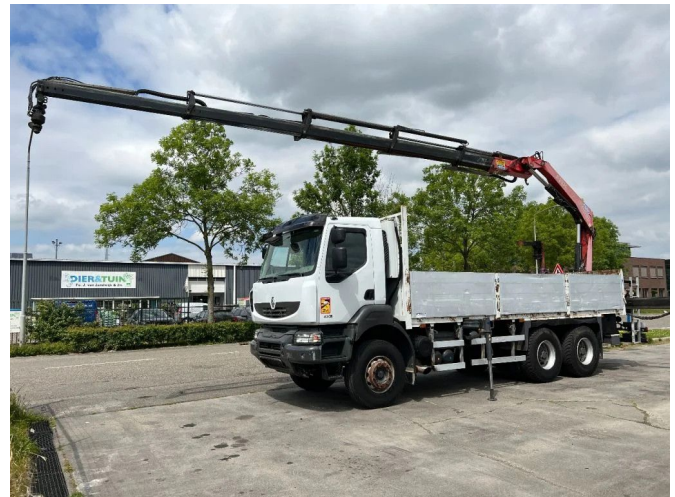
Renault Kerax 430 6X4 EURO 5 + FASSI F210AC.25 + REM...