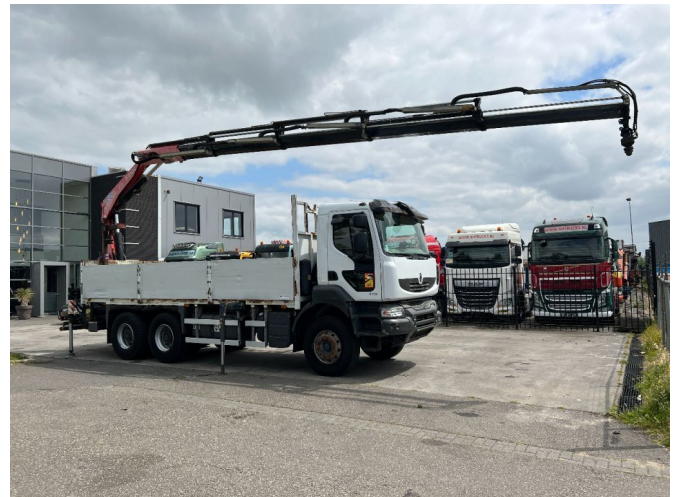
Renault Kerax 430 6X4 EURO 5 + FASSI F210AC.25 + REM...