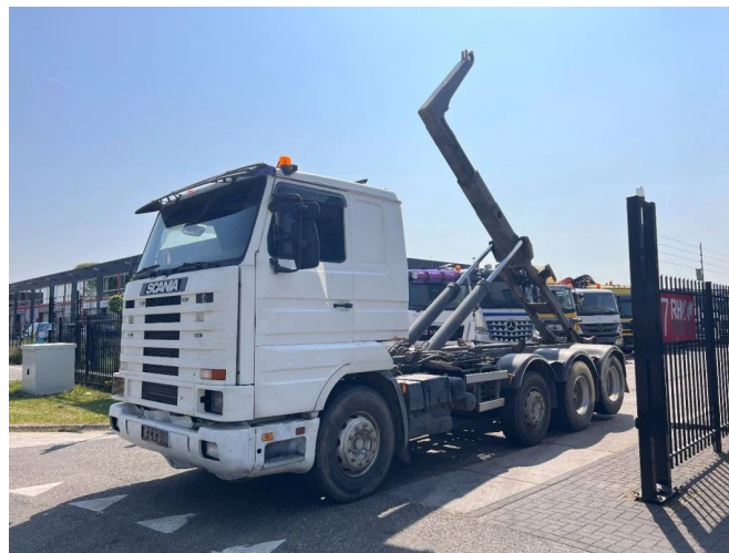
Scania R113-380 8X2/4L - HOOKLIFT - MANUAL GEARBOX