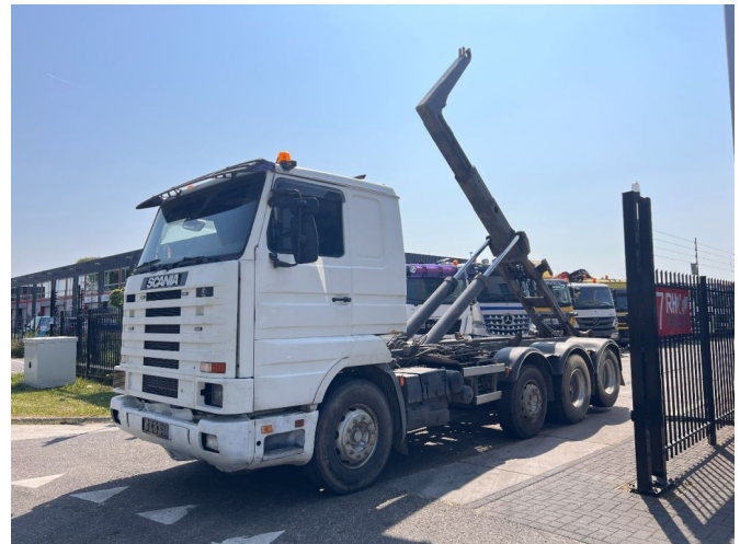
Scania R113-380 8X2/4L - HOOKLIFT - MANUAL GEARBOX