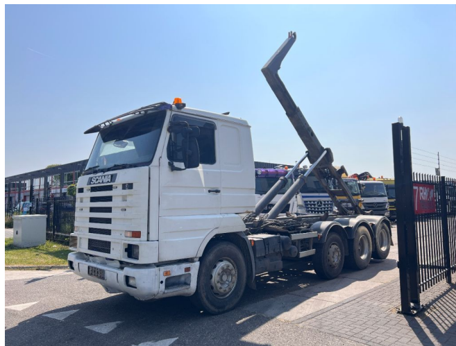
Scania R113-380 8X2/4L - HOOKLIFT - MANUAL GEARBOX