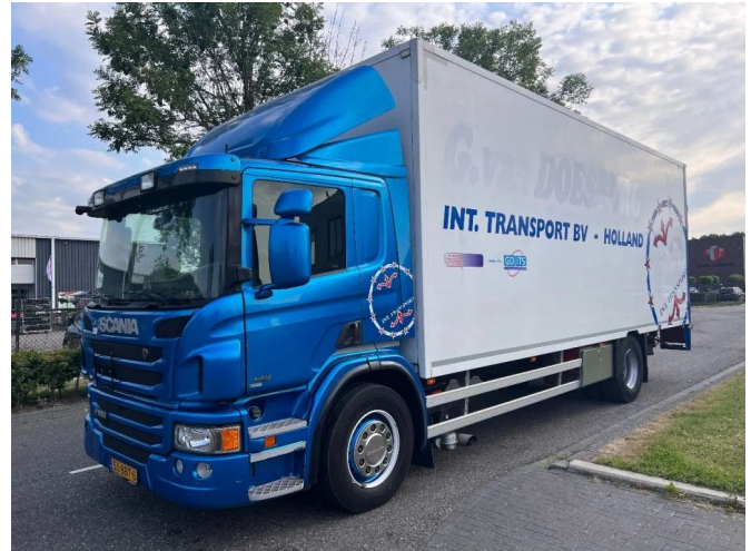
Scania P250 4X2 EURO 6 - 20 TON - BOX 7,75 METER + D...