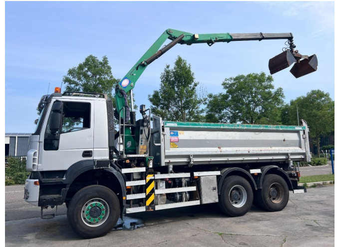
Iveco Trakker 380T41 6X6 - HMF 1643 Z2 + 2-WAY TIPPER