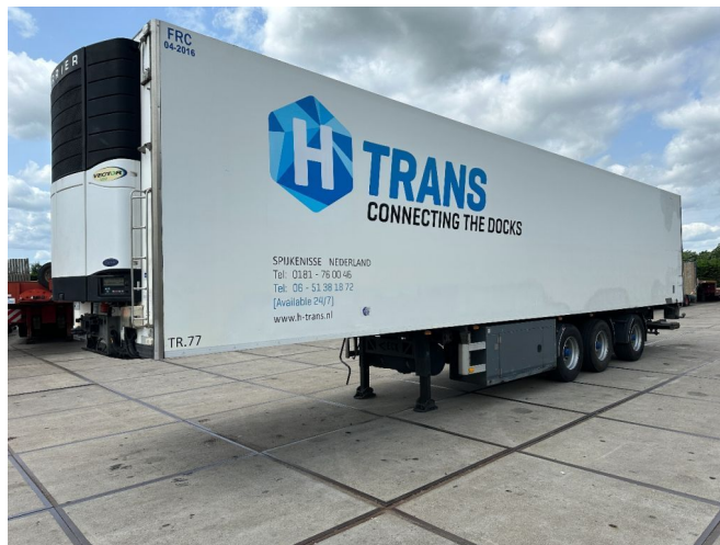
VAN ECK 3 AXEL CARRIER VECTOR 1850 D/E