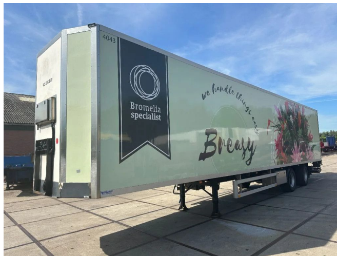
Burg LAST AXEL STEERING + LOAD LIFT