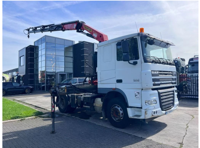
DAF XF 105.410 4X2 EURO 5 MANUAL + PALFINGER PK16...