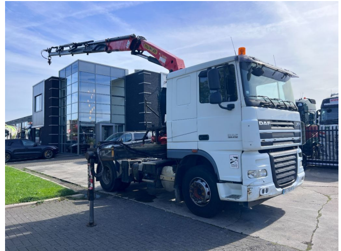
DAF XF 105.410 4X2 EURO 5 MANUAL + PALFINGER PK16...