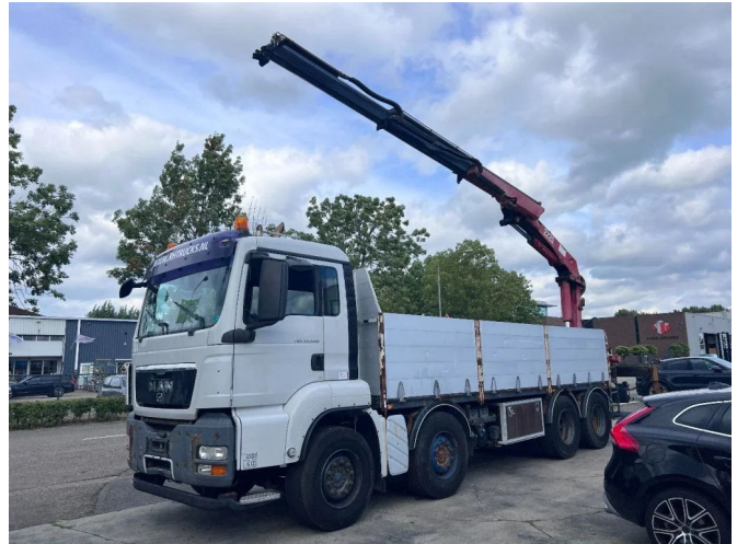
MAN TGS 35.440 8X4 + HMF 2220 K2 MET REMOTE