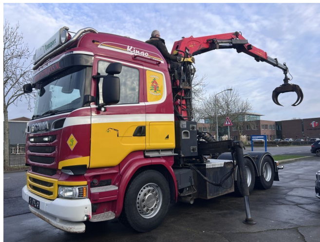
Scania R520 V8 6X4 EURO 6 + PALFINGER EPSILON E250...