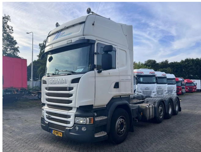
Scania R490 8X2 EURO 6 RETARDER