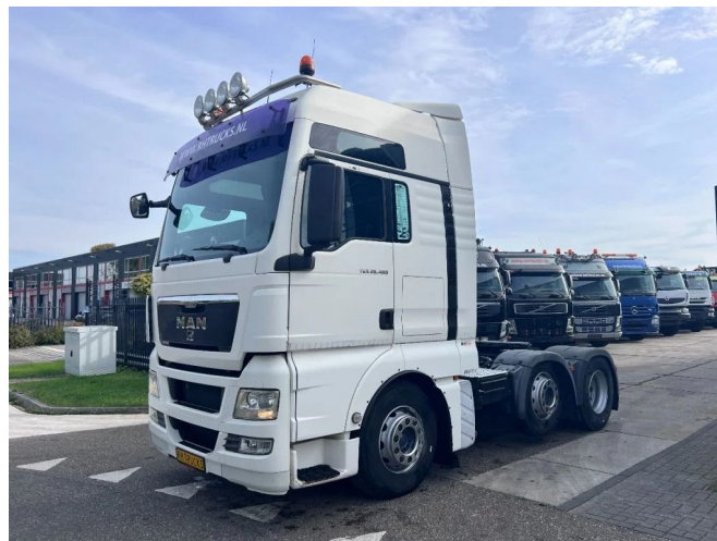
MAN TGX 26.480 6X2 MANUAL GEARBOX + HYDRAULIC