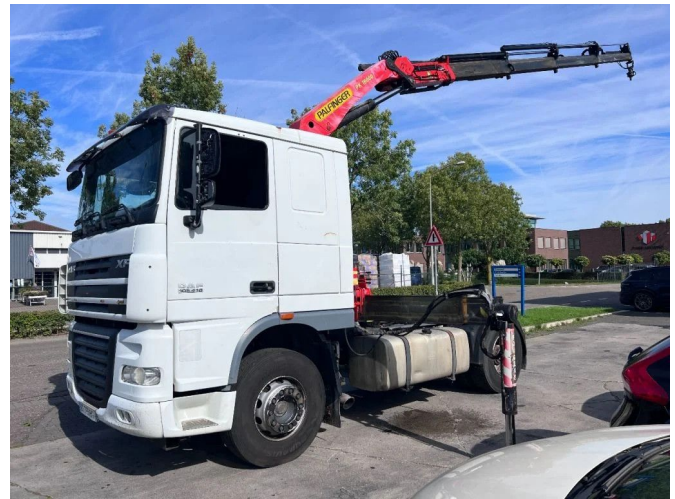
DAF XF 105.410 4X2 EURO 5 MANUAL + PALFINGER PK16...