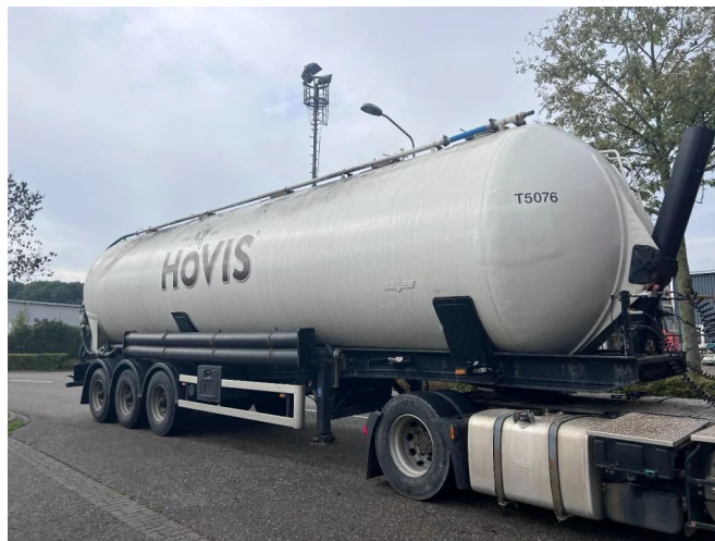
SPITZER SK2458 SILO 58.000L