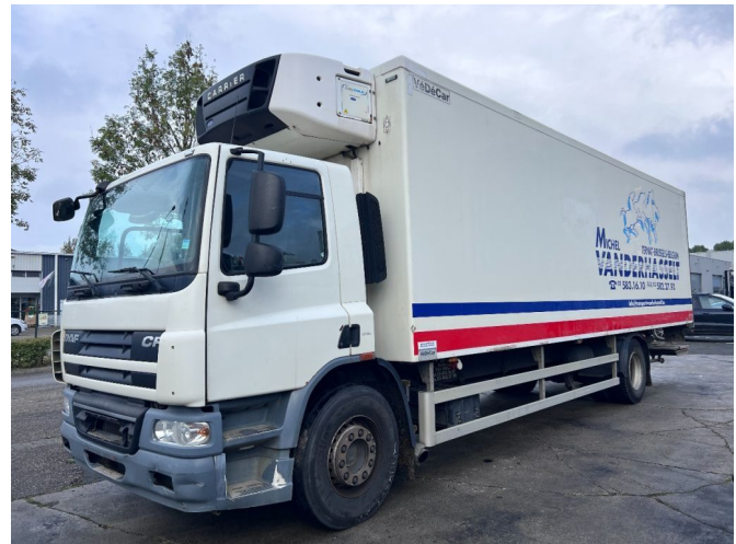
DAF CF 75.250 4X2 CARRIER SUPRA + DHOLLANDIA