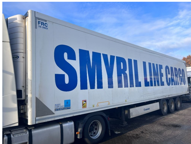
Krone SD FRIGO + CARRIER VECTOR - 3x BPW