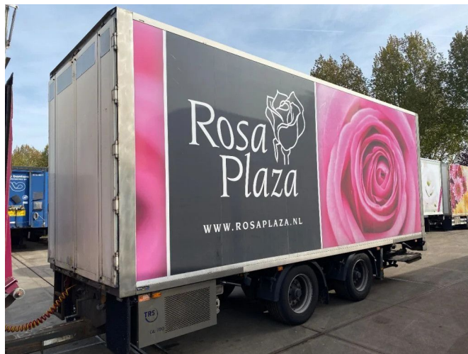
DRACO 2 AS - BPW + TRS FRIGO