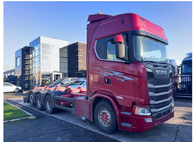
Scania S580 V8 NGS 8X4*4 EURO 6