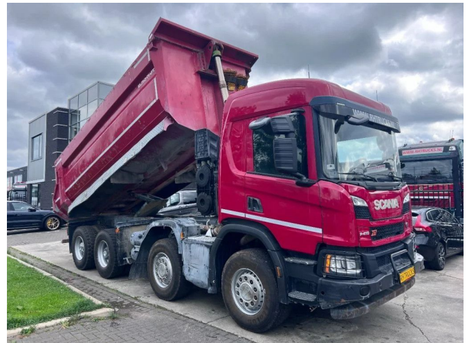
Scania P410 8X4 EURO 6 BIG AXLES