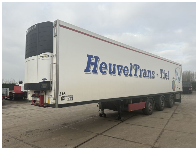
VAN ECK Carrier Maxima 1800