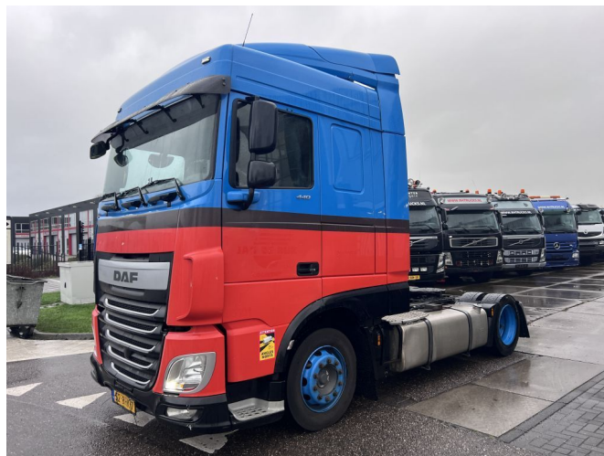
DAF XF 440 SC 4X2 MEGA 2x ALU TANK