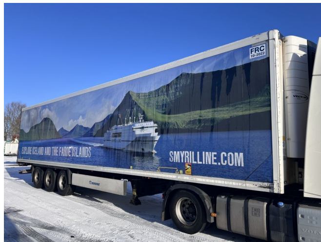
Krone SD CARRIER VECTOR - 3x BPW