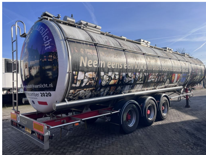
Burg Levensmiddelen 60.000L - 3 KAMMERS