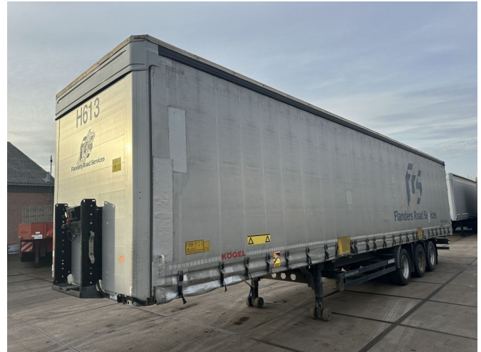
Kögel 4 UNITS - S24 3xBPW 1362x248x275 LxBxH