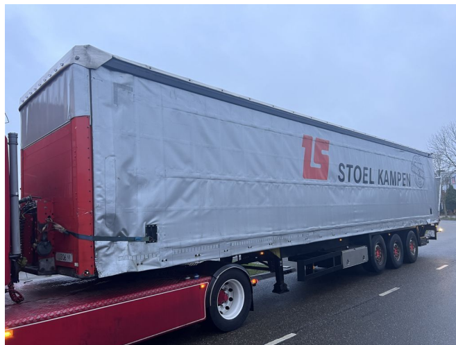
Schmitz Cargobull S01 + LAADKLEP + LIFT + STUURAS