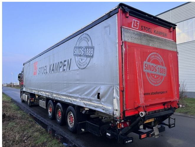
Schmitz Cargobull S01 + LAADKLEP + LIFT + STUURAS